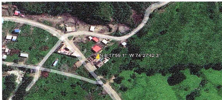
Figura N°1

Por tanto, la Subdirección de Gestión Ambiental comisiono a un funcionario suscrito a esta Subdirección para realizar Visita Ocular.